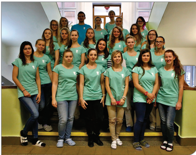
ZÁSTUPCI DVANÁCTI ŠKOL CELÉ ČR