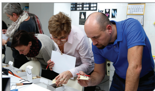
HODNOCENÍ MODELACE POROTOU

Vzhledem k velmi příznivému hodnocení a ohlasu účastníků nás tato událost zavazuje k uspořádání soutěže i v příštím roce s úvahou přizvat též stu- denty oboru zubní technik z Drážďan. Také chys- táme změny v oficiální části, především z hlediska hodnocení prací naprosto nezávislou komisí z řad odborníků, paralelně uspořádat i malou soutěž, kde se zapojí do hodnocení samotní soutěžící a více odborných prezentací pro doprovázející peda- gogy. Setkání kolegů v takovém měřítku by mohlo být pro mnohé velmi inspirativní a zároveň mož- ností předat si určité zkušenosti z vlastních peda- gogických aktivit. <<<