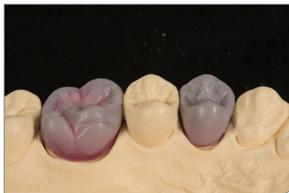
2. místo - KATEŘINA FANTOVÁ - VOŠZ a SŠZ Brno